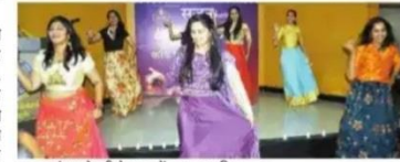
सृजन संस्था के दीपोत्सव में नृत्य प्रस्तुति।